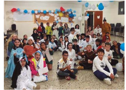
Vestidos de santos en San Fortunato.