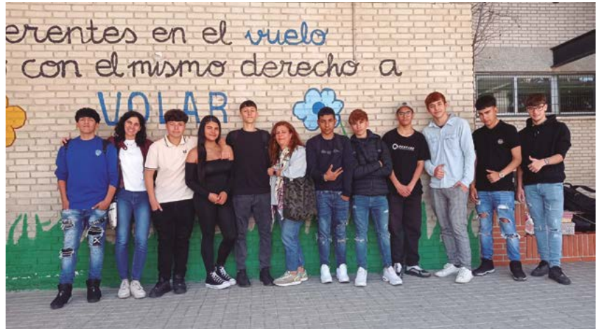
El obispo, en una visita a la ECAM con autoridades municipales. Arriba, un grupo de alumnos con su profesora.

La escuela imparte ciclos de grado medio y superior, formación profesional básica y diversos cursos.