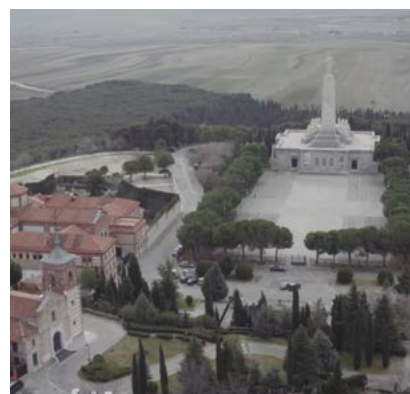
El Santuario del Cerro de los Ángeles.