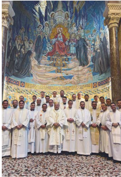
Los peregrinos, en Paray le Monial.