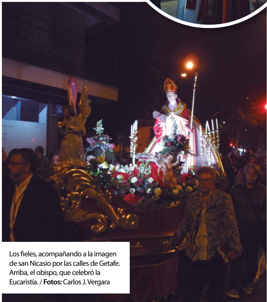
Los fieles, acompañando a la imagen de san Nicasio por las calles de Getafe. Arriba, el obispo, que celebró la Eucaristía.