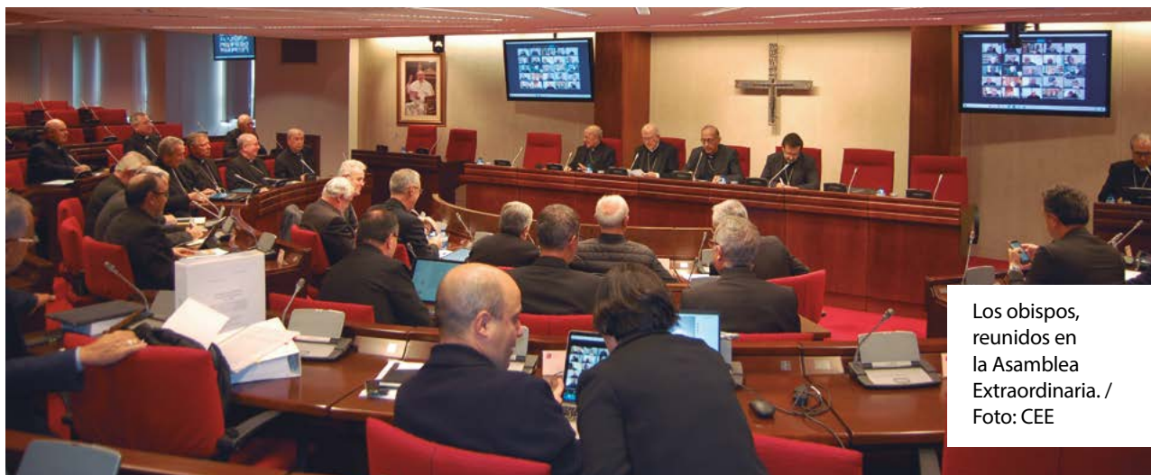
Los obispos, reunidos en la Asamblea Extraordinaria.