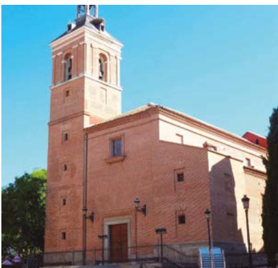
Imagen del templo leganense.

Además, pasará por la sinagoga judía y por la iglesia ortodoxa rumanas existentes en la localidad, se reunirá con diferentes grupos de matrimonios y de novios y visitará a los enfermos y a los mayores.