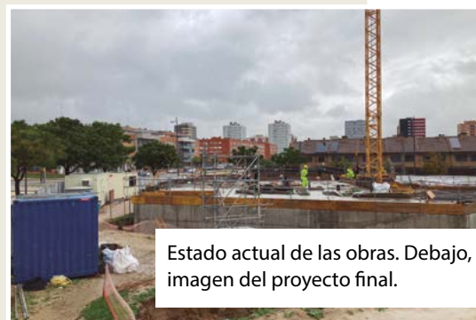
Estado actual de las obras. Debajo, imagen del proyecto final.

Para facilitar la colaboración y hacer más sencillas las donaciones, se ha dividido cada banco en cinco plazas. Por ello, también existe la posibilidad de donar un asiento (180 euros).