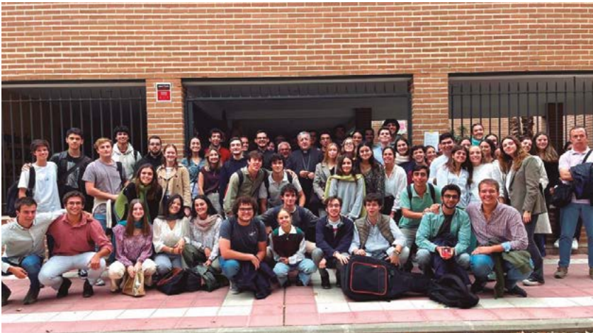
El obispo, con los miembros de la asociación universitaria Totus Tuus.