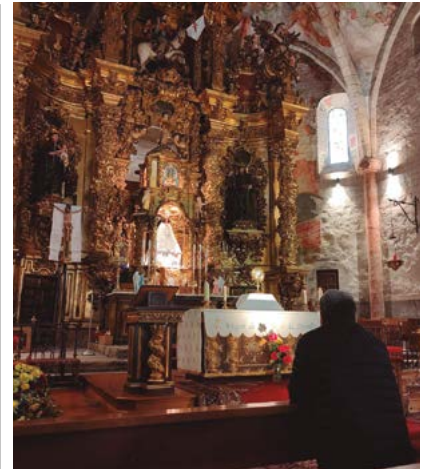
El obispo, rezando en la parroquia.

Esta iniciativa forma parte de la formación permanente y del cuidado de los sacerdotes diocesanos más jóvenes.