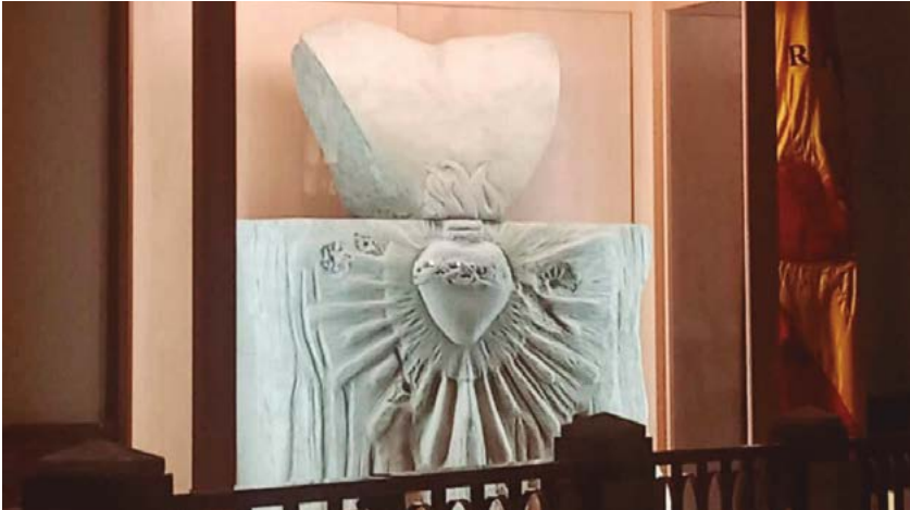
El Sagrado Corazón quedó intacto pese a estar rodeado de impactos de bala.