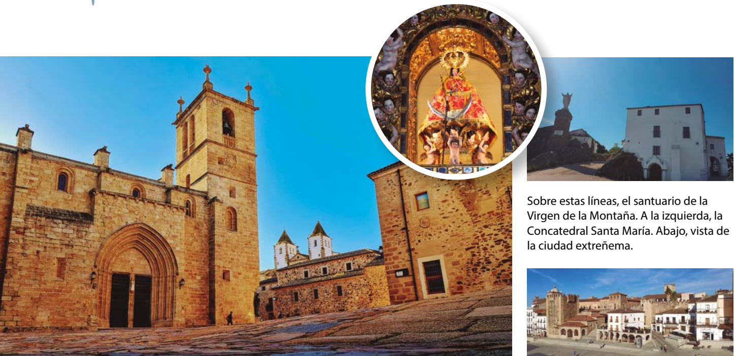
Sobre estas líneas, el santuario de la Virgen de la Montaña. A la izquierda, la Concatedral Santa María. Abajo, vista de la ciudad extremeña.