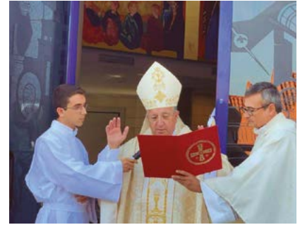
Diferentes momentos de la ceremonia de apertura de la Puerta Santa de la Parroquia Nuestra Señora del Pilar, con la que el obispo diocesano dio comienzo a un año de gracia en esta comunidad de Valdemoro.