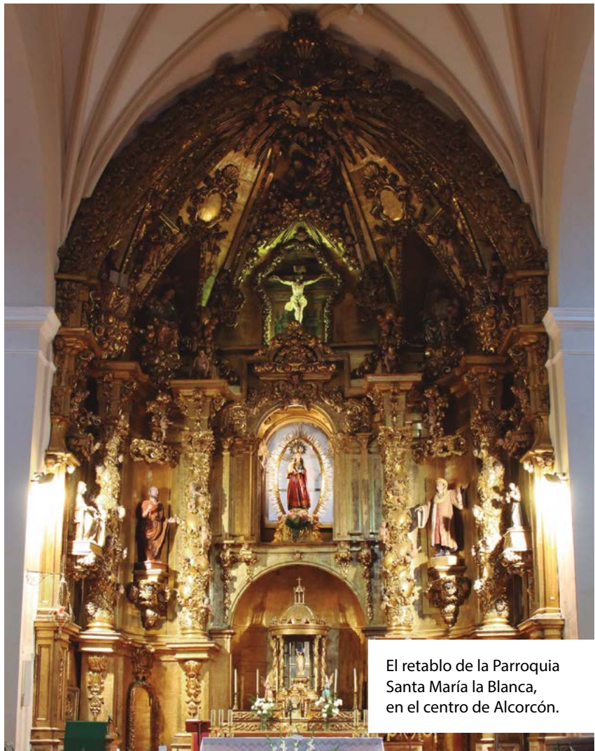
El retablo de la Parroquia Santa María la Blanca, en el centro de Alcorcón.

En la parte superior, el Cristo de las Lluvias corona el retablo, rodeado por los cuatro evangelistas, aquellos que dieron testimonio del misterio pascual. Más abajo, ocupa el lugar central del retablo la imagen de la Virgen. Ella, mejor que nadie, cumplió la Palabra que se encarnó en su seno y que hoy se nos entrega en la Eucaristía, reservada en el sagrario, que se encuentra en la parte inferior del retablo.