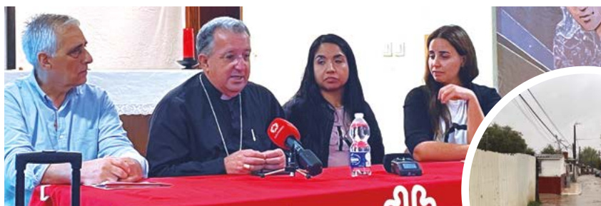
El acto de presentación, celebrado en Las Sabinas (a la derecha).

El Servicio Diocesano de Vivienda trabaja para sensibilizar sobre el derecho a la vivienda y acompaña a personas en riesgo de perder su residencia habitual.