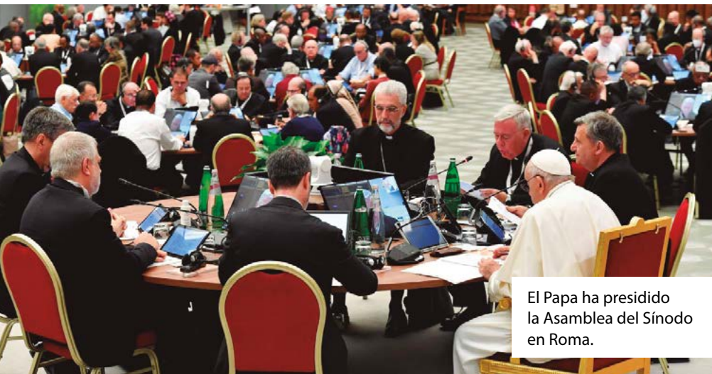
El Papa ha presidido la Asamblea del Sínodo en Roma.