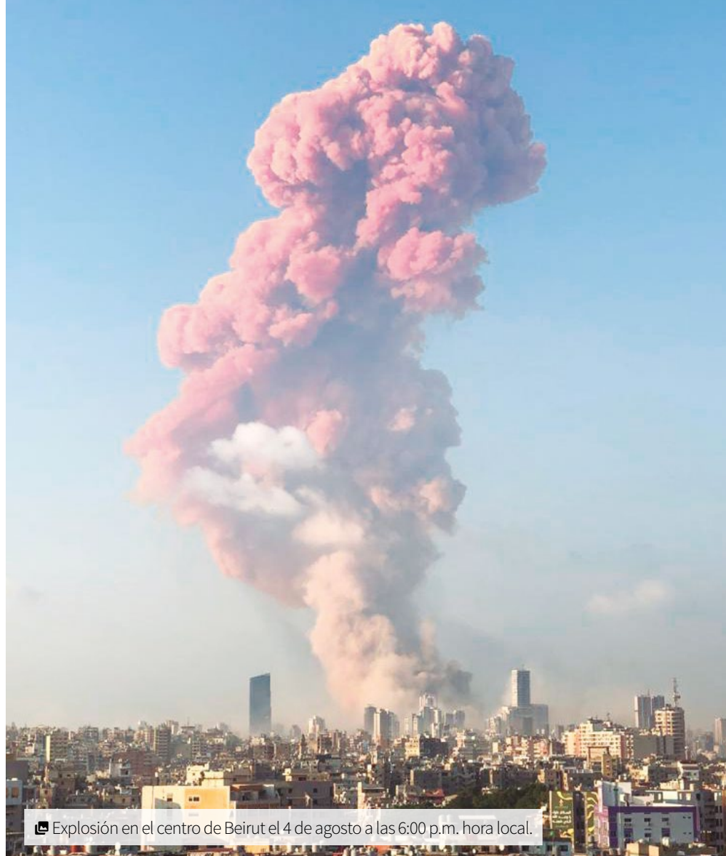
Explosión en el centro de Beirut el 4 de agosto a las 6:00 p.m. hora local.

Su iglesia tiene gran valor histórico, fue construida en 1890 y está situada en un lugar muy simbólico porque limita con barrios no cristianos. “Somos una especie de puerta de entrada al barrio cristiano”, dice contento. Ahora la iglesia de San Salvador necesita un nuevo techo y arreglar una gran grieta para que la estructura no se venga abajo.