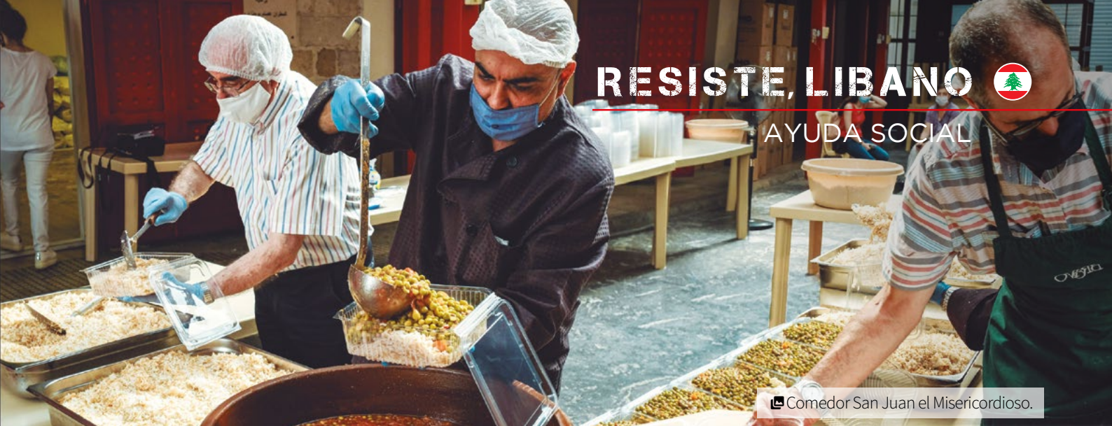
Comedor San Juan el Misericordioso.