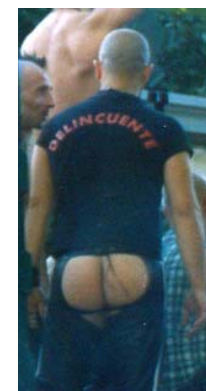
Imágenes tomadas en la manifestación del "Día del orgullo gay" (Madrid, 2 de julio de 2005)