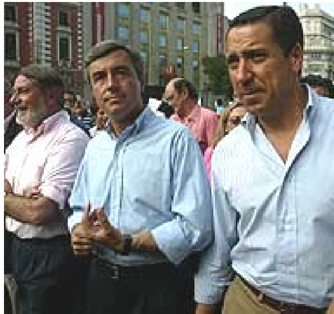
Representantes del Comité Ejecutivo del PP junto a decenas de miles de ciudadanos en la manifestación a favor de la familia (Madrid, 18-6-05)

“Es necesario un esfuerzo para terminar con la homofobia existente, como lo demuestra el Foro de la Familia” (30 junio 2005, 17 días después de que el PP apoyara oficialmente su adhesión a la manifestación... organizada por el Foro de la Familia)