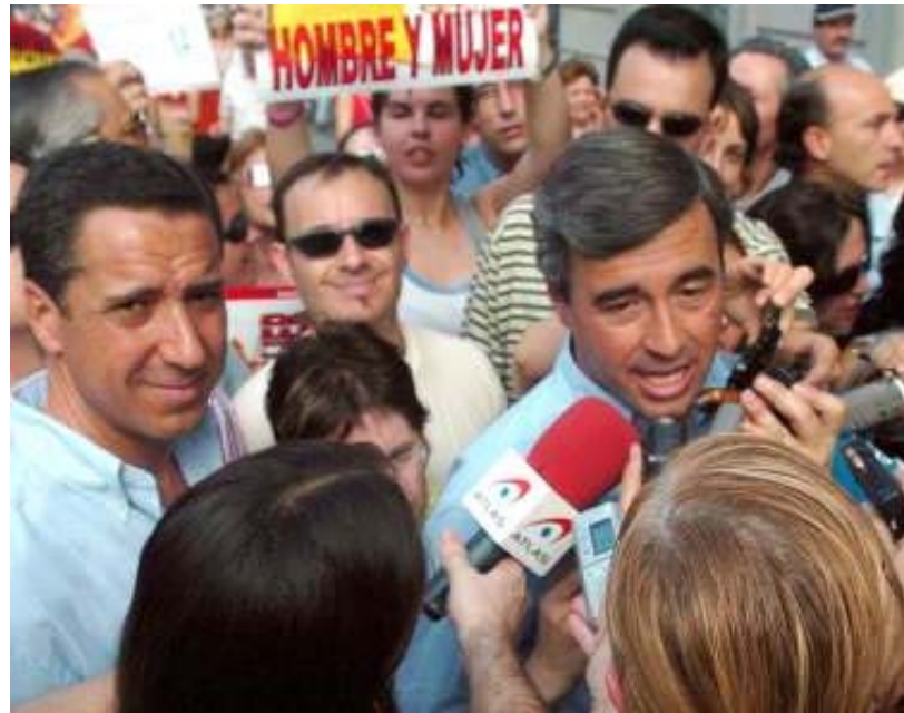
Eduardo Zaplana y Ángel Acebes, representando al PP en la manifestación a favor de la familia (Madrid, 18-6-05)

“El presidente de la Plataforma Popular Gay, Carlos Biendicho, criticó ayer el apoyo expreso de su partido a la manifestación y pidió a Rajoy que llame a todos los afiliados a no acudir a la misma en calidad de miembros del partido”. (Efe, 15-6-05)